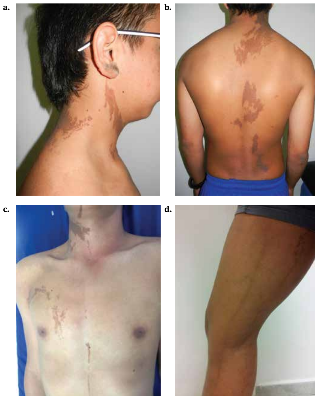
FIGURA 1. Placas hiperpigmentadas de color café oscuro y de aspecto verrugoso, que siguen un trayecto lineal, localizadas en lóbulo de la oreja derecha, región submandibular y cuello (a), espalda (b), cara anterior del tórax (c), muslo y pierna del mismo lado (d)

personales refirió fractura de fémur a los dos años de edad y no tenía antecedentes familiares de importancia.