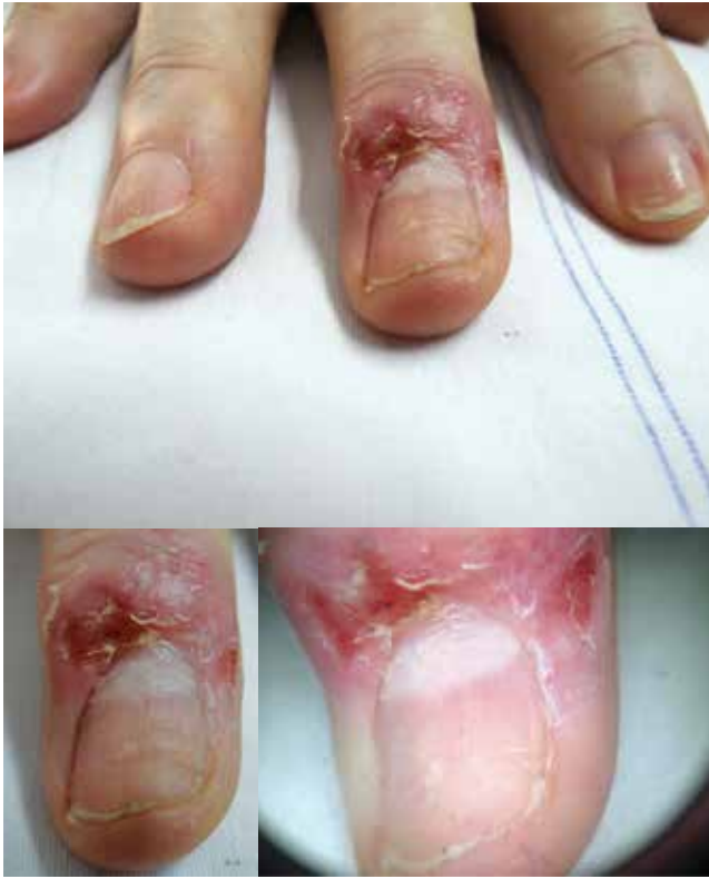
FIGURA 1. Hallazgos en el examen físico. En el tercer dedo de la mano derecha se observa una placa eritematosa, edematosa, descamativa con ulceraciones superficiales. En la lámina ungular se aprecian líneas de Beau. En la dermatoscopia se encontraron vasos puntiformes atípicos.

Se decidió tomar biopsia de piel con la impresión diagnóstica de un carcinoma escamocelular. Finalmente, el reporte de patología fue un carcinoma basocelular sólido de la unidad ungular ( FIGURA 2 ). Con estos hallazgos, fue remitida para cirugía de Mohs.