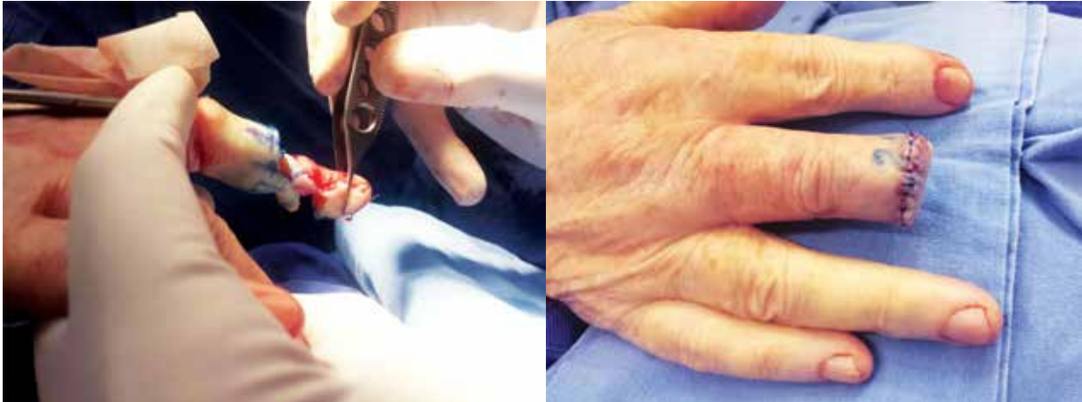
FIGURA 3. Mohs diferido, amputación y reconstrucción con colgajo volar.

ción con la radiación ionizante, el trauma y la exposición solar, sin haberse encontrado una diferencia estadísticamente significativa 2,3,5 .