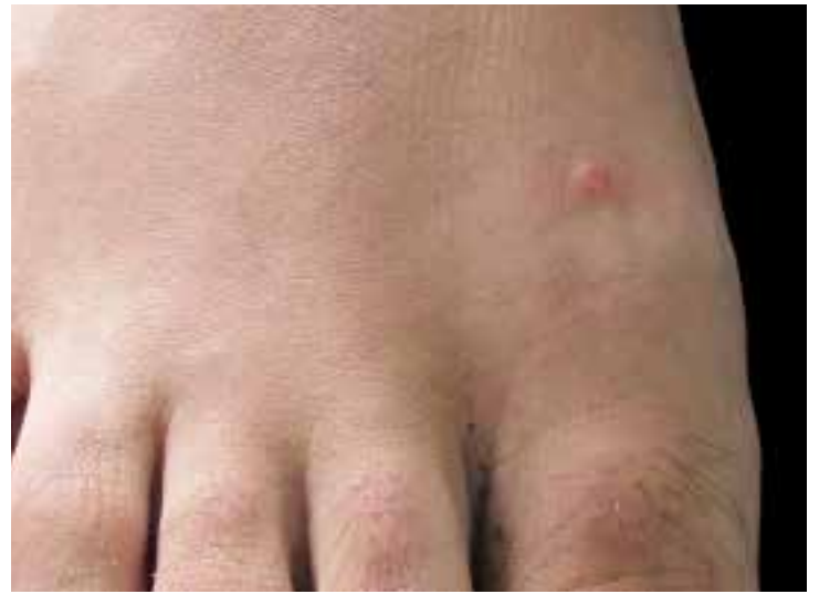
FIGURA 2. Aspecto de las pápulas en el dorso del pie derecho.

en zonas donde previamente había sufrido picaduras de insecto. Recibió tratamiento con doxiciclina oral durante dos semanas y con corticoides tópicos durante un mes, sin notar mejoría. No refirió antecedentes personales o familiares de importancia.