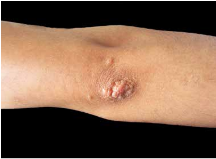
FIGURA 1. Aspecto de las pápulas en el codo derecho.