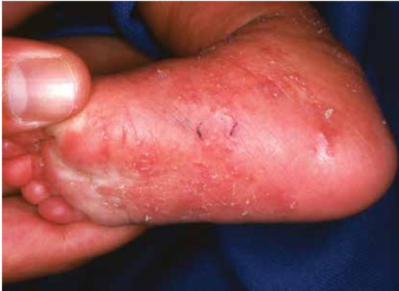
FIGURA 6. Sarna: surcos revelados con tinta china

ducen a hacer un diagnóstico preciso. Fueron popularizadas por el ilustre y finado maestro A. B. Ackerman, quien escribió tres tomos magníficos sobre ellas 1,2,3 . También, se pueden estudiar en su página Derm101.com.