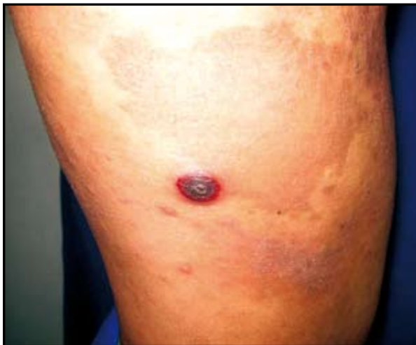
FIGURAS 1 Y 2: Micosis fungoide.