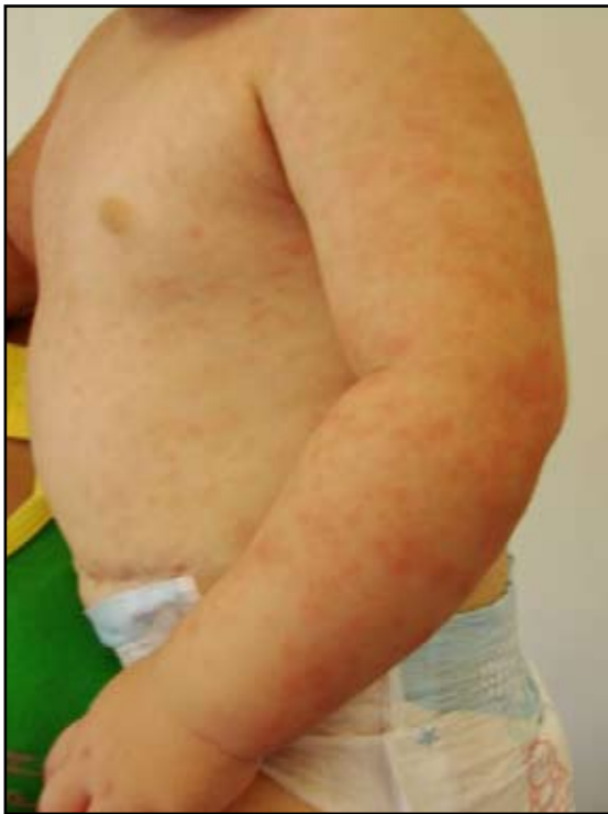
FIGURA 1: Brote macular eritematoso en el tronco.