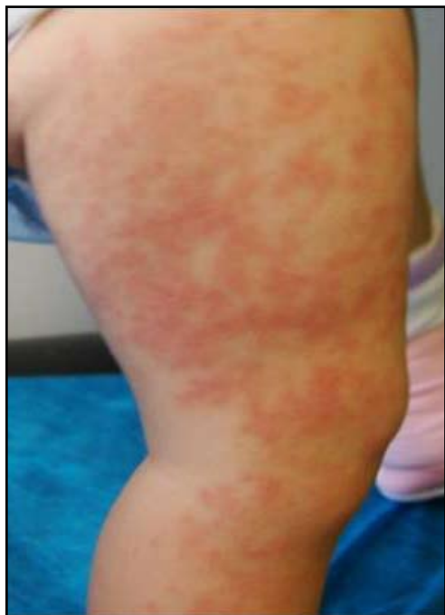
FIGURA 2: Lesiones en los miembros inferiores.

La paciente fue tratada con desonida en emulsión y pasta al agua, con resolución total del cuadro al mes de tratamiento.