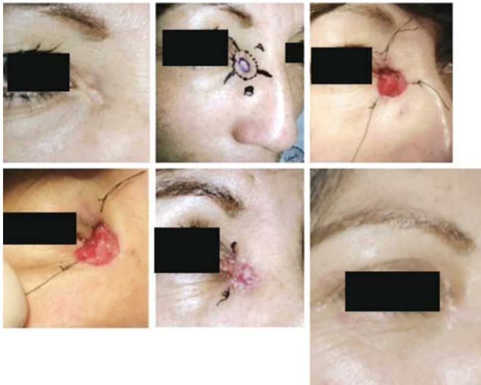
FIGURA 3: CBC sólido y adenoide, dos estados de CMM. Cierre por segunda intención. Seguimiento al tercer año.

estado de Mohs, y hubo un caso de Mohs inconcluso por compromiso de la órbita.