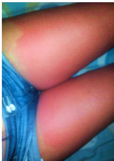
Figura 1. Presencia de habones de gran tamaño en los muslos.

artralgias, pérdida de peso u otras manifestaciones que sugieran enfermedad sistémica subyacente; sin embargo, manifiesta aparición ocasional de lesiones micropapulares en las manos cuando se expone al calor.