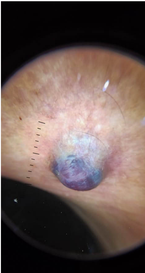
Figura 2. Dermatoscopia.