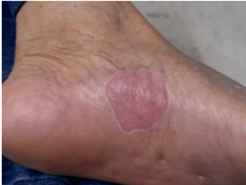
Figura 1. Placa atrófica rosada con bordes hiperqueratósicos lineales, fisuras centrales y erosiones localizada en el arco plantar del pie izquierdo.