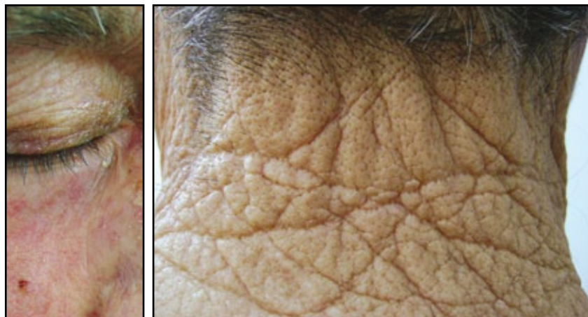
FIGURA 4. Telangiectasias y arrugas en área de daño por luz solar.

Cada uno de los cambios estructurales fisiológicos que describimos, finalmente, produce un cambio patológico con algún significado clínico, como se muestra en la tabla a continuación.