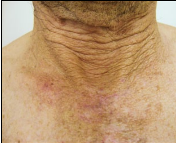
FIGURA 1. Poikilodermia en área de exposición solar crónica.

adhiera al tejido fibroso, que les da firmeza y adherencia a los tejidos. Entre estos tejidos fibrosos está el sistema subcutáneo muscular aponeurótico (subcutaneous muscular aponeurotic system, SMAS), la fascia fibrosa que recubre los músculos de la cara, les da soporte y permite su adherencia a la piel, lo que permite el movimiento coordinado de la piel y los músculos. Sin embargo, el estiramiento continuo producido por los movimientos de la mímica hace que los puntos de anclaje de la piel a las estructuras profundas se pierdan, lo cual modifica la morfología facial y acentúa las líneas de expresión 31 .