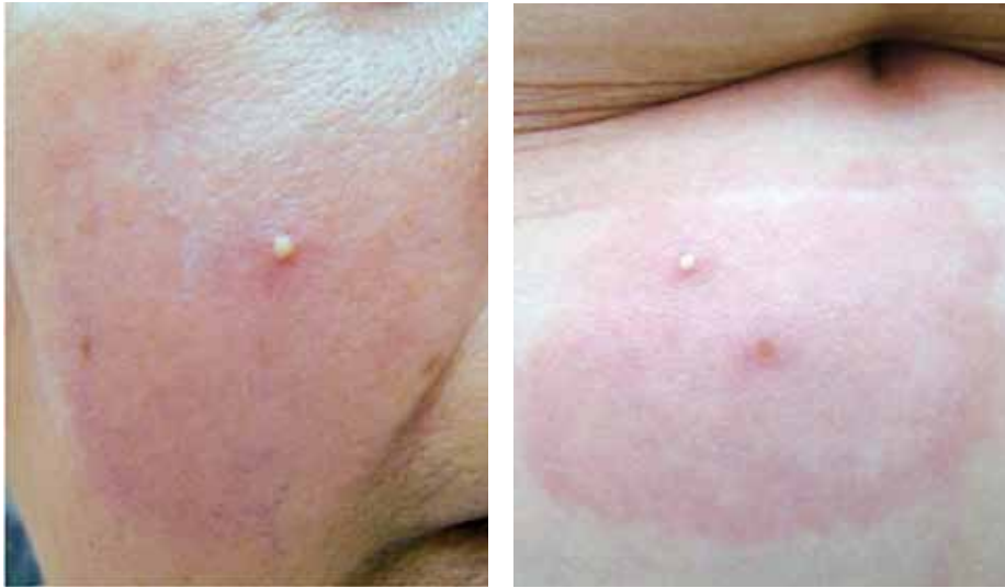
FIGURA 1. Pústula sobre una placa edematosa en la mejilla derecha