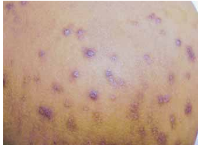
FIGURA 1. Papula hiperpigmentada con tapón queratósico.

La patogenia exacta es aún desconocida, y se han pro-