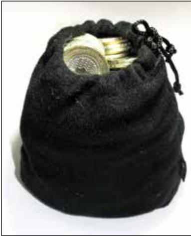
FIGURA 4. Bolsa portamonedas.

por el menor tamaño de la herida abierta y un menor tiempo de cicatrización en comparación con la cicatriz mayor en un cierre por segunda intención 19 . Con esta sutura ocurre una mínima distorsión de las estructuras adyacentes por razones geométricas, pues la tensión se aplica a lo largo de múltiples líneas radiales con un patrón de distribución concéntrica, en lugar de la tensión aplicada a lo largo de un eje perpendicular a la línea de la herida 20 . El calibre de las suturas empleadas varía de 6-0 a 1-0, dependiendo del área de piel, pero usualmente se emplean las de mayores diámetros 13 . Nosotros empleamos calibres 3-0, 4-0 y 5-0.