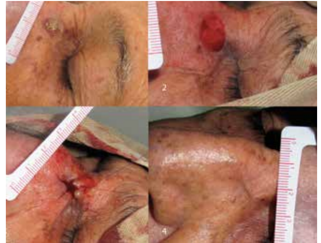
Figura 3. Carcinoma escamocelular; sutura utilizada: polipropileno 5-0. Lesión clínica; B. Defecto quirúrgico; C. Defecto suturado; D. Aspecto a las 10 semanas.

procedimiento independiente para el cierre de defectos redondos y ovalados 4,5 .