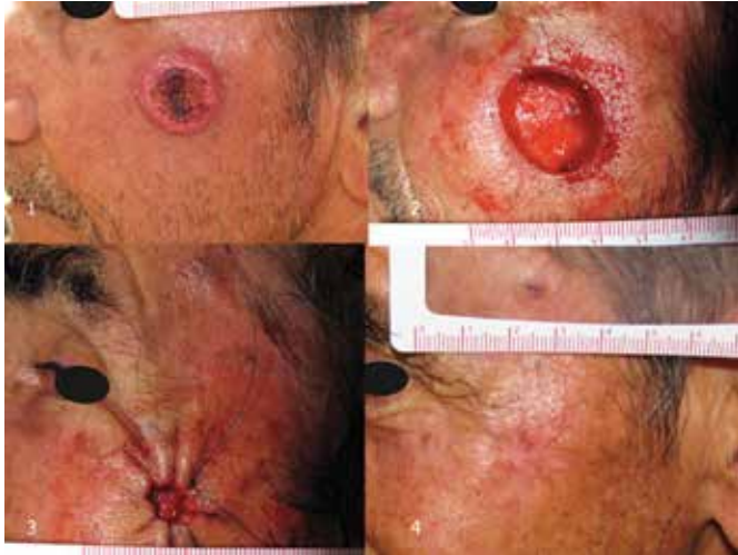
Figura 2. Queratoacantoma; sutura utilizada: polipropileno 4-0. A. Lesión clínica; B. Defecto quirúrgico; C. Defecto suturado; D. Aspecto a las 8 semanas.