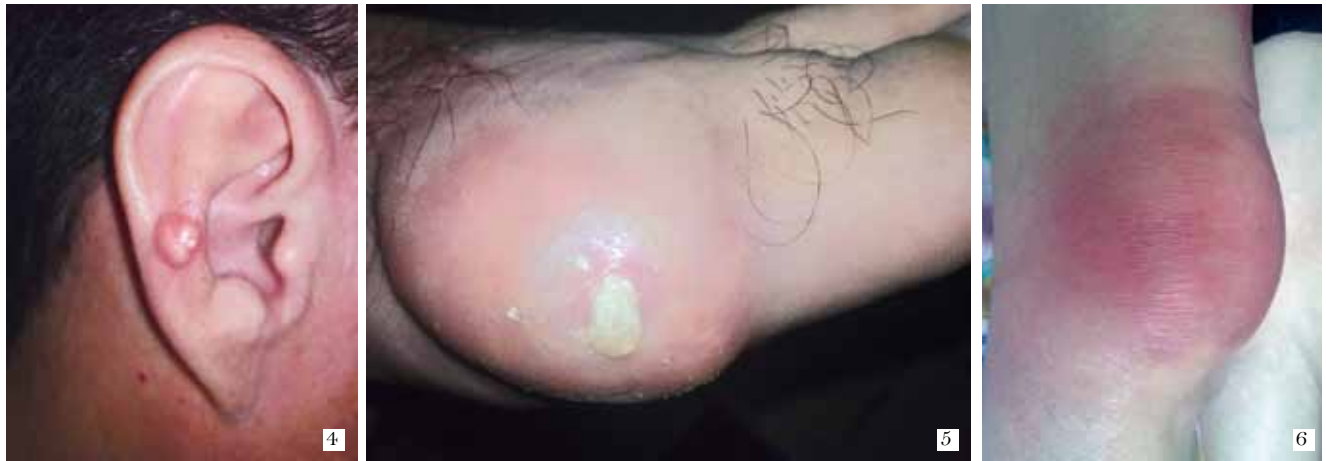
FIGURA 4. Ubicación poco común de un tofo en la antihélix. FIGURA 5. Tofo en la articulación metatarso-falángica que drena un material descrito como “crema de dientes”. FIGURA 6. Bursitis prepatelar de origen infecciosa; cuadro clínico idéntico al de una bursitis prepatelar por gota.

tobillos y las rodillas, también pueden verse comprometidas. Las articulaciones centrales, como el hombro, las caderas y la columna, rara vez se afectan debido a las mayores temperaturas que impiden la cristalización, aunque en la gota tofácea pueden verse comprometidas. La gota puede afectar las bolsas, los tendones y los ligamentos. Es de anotar que un tercio de los pacientes presenta niveles normales de ácido úrico durante las crisis 10,11 . La duración del ataque es de una a dos semanas, y desaparece, incluso de manera espontánea.