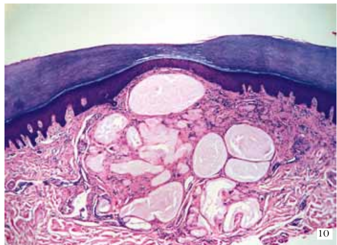
FIGURA 7. Radiografía lateral de codo en la que se observa una erosión en el olecranon, con calcificaciones granulares en los tejidos blandos, lo que configura un tofo calcificado. FIGURA 8. Con microscopía de luz se observa un cristal de urato monosódico intracelular en forma de aguja. FIGURA 9. Se observan varios cristales de urato monosódico, los amarillos paralelos al compensador y los azules perpendiculares al mismo, usando un microscopio de luz polarizada. FIGURA 10. Se observa cristales de urato monosódico en la dermis media y profunda, rodeados por un infiltrado de macrófagos y células gigantes.

depósito de cristales de pirofosfato, estrechando aun más los diagnósticos; pero la recurrencia de la enfermedad en la misma o en otra articulación es un hallazgo distintivo de la gota y de la enfermedad por depósito de pirofosfato.