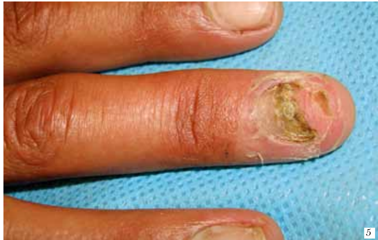
FIGURA 4. Múltiples placas blancas en pene sobre base eritematosa. Figura 5. Onicomicosis con distrofia ungular, cromoniquia y paroniquia secundaria a Candida spp.