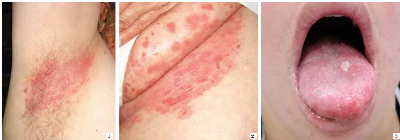
FIGURA 1. Placa eritematosa con pápulas satélites en el pliegue axilar. FIGURA 2. Placa eritematosa en el área intertriginosa. FIGURA 3. Placas blanquecinas en la lengua y los ángulos de la mucosa bucal.

como levaduras ovoides, acompañadas de pseudohifas y, a veces, hifas tabicadas, a excepción de C. glabrata que sólo tiene blastoconidias; crecen a temperatura ambiente y a 37 °C. Algunas de las especies hacen parte de la flora del cuerpo humano, viven en la piel y en diversas mucosas, incluyendo la boca, la vagina, la uretra, el tubo digestivo y la vía respiratoria superior.