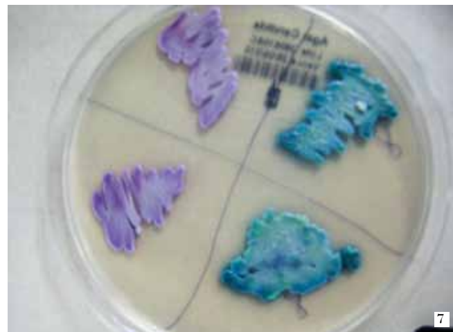
FIGURA 6. Examen directo KOH muestra Candida spp. Tubo germinal. Figura 7. Medios de cultivo cromogénicos.