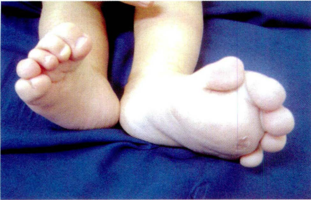
Figura 2. Se aprecia aumento de tamaño del pie izquierdo en relación con su contralateral.

Paciente de sexo femenino, de ocho meses de edad, quien desde el nacimiento presenta gigantismo localizado en el pie derecho que compromete los arcos y el antepié (Figura 2). Antecedentes personales y familiares negativos.