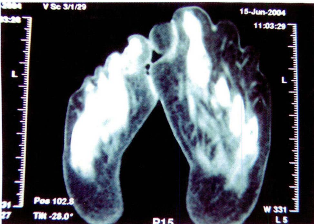
Figura 3. Tomografía axial computarizada que demuestra compromiso óseo y de tejidos blandos

En la radiografía se observa hiperdesarrollo de las estructuras óseas y los tejidos blandos en el pie izquierdo. En la tomografía se puede apreciar que los tejidos blandos comprometidos corresponden con la densidad del tejido graso (Figura 3).